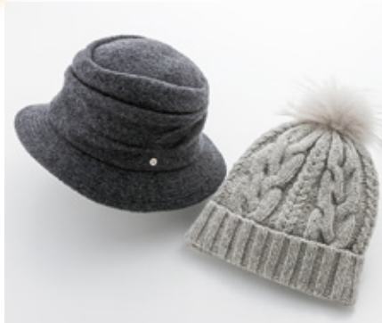
婦人帽子各種 本体価格5,000円(税込5,500円)