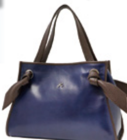
■牛革ハンドバッグ (牛革/紺・ライトグレー・赤) 本体価格25,000円(税込27,500円)

ヨコハマ元町で育んだ自由な発想や インターナショナルな感性をもとに比類なき バッグ作りへのこだわりと元町ストーリーが 織りなす〈キタムラK2〉のバッグを期間限定で ご提供いたします。