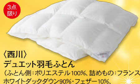
3点限り 〈西川〉デュエット羽毛ふとん (ふとん側:ポリエステル100%、詰めもの:フランスホワイトダックダウン90%・フェザー10%、詰めもの重量:合掛け0.8kg・肌掛け0.3kg) 本体価格40,000円(税込44,000円) 【3階=寝具】