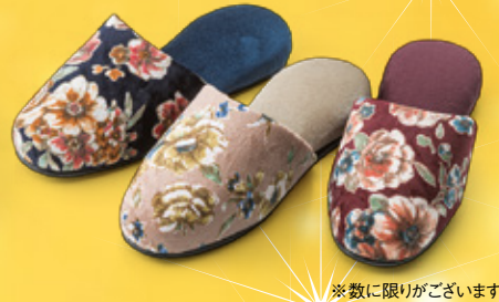
※数に限りがございます。 ※写真は一例です。 スリッパ各種 本体価格1,000円(税込1,100円) 【3階=家庭用品】