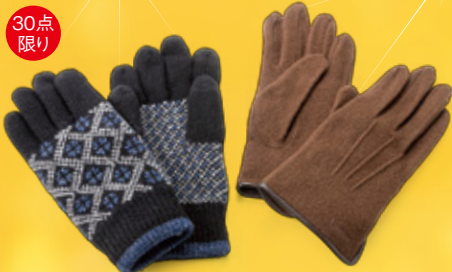
30点限り 紳士手袋各種 ※写真はイメージです。 本体価格2,000円(税込2,200円) 【2階=紳士雑貨】