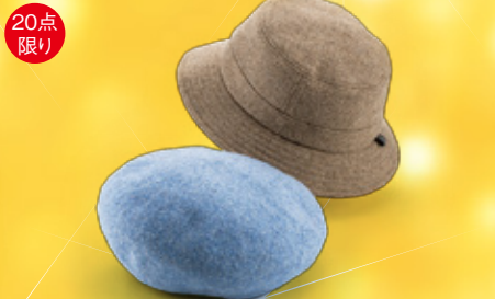
20点限り 婦人帽子各種 本体価格3,000円(税込3,300円) 【2階=婦人雑貨】