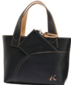
■牛革ハンドバッグ (牛革/黒×ベージュ・トリコ・紺×白) 本体価格26,000円(税込28,600円)