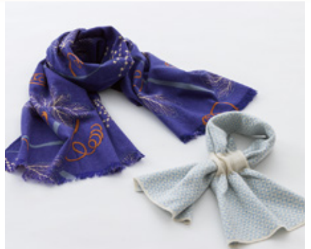
婦人マフラー・ストール各種 本体価格7,000円(税込7,700円)