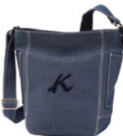
■ショルダーバッグ (デニム/黒・ブルー) 本体価格15,000円(税込16,500円)