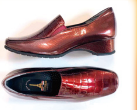
婦人靴(牛革エナメル) 本体価格12,800円(税込14,080円)