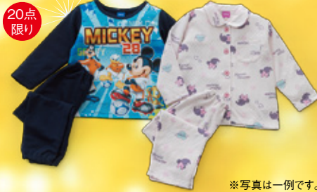
20点限り キャラクターパジャマ各種(110~130cm) ※写真は一例です。 本体価格1,500円(税込1,650円) 【3階=子供服】