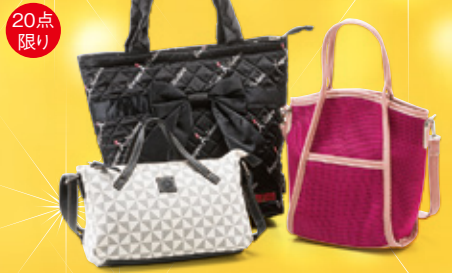
20点限り カジュアルバッグ各種 ※写真は一例です。 本体価格2,000円(税込2,200円) 【2階=ハンドバッグ】