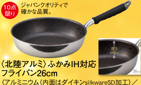
10点限り ジャパングオリティで 確かな品質。 〈北陸アルミ〉ふかみIH対応 フライパン26cm (アルミニウム(内面はダイキンスilkkwareSD加工) / ガス火・IH(100V・200V)対応) 本体価格2,000円(税込2,200円) 【3階=家庭用品】