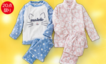
20点限り ももこナイティ各種 本体価格2,000円(税込2,200円) 【3階=婦人ナイティ】