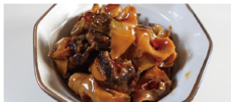
【小樽市・小松食品】つぶ甘露煮 (100g)……………本体価格 900 円(税込972円)