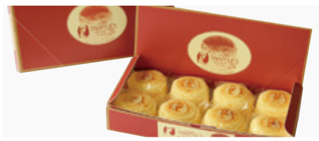
【函館市・函館洋菓子スナッフルス】 チーズオムレット(8個入) [各日先着15点限り] ……………本体価格 1,600 円(税込1,728円)