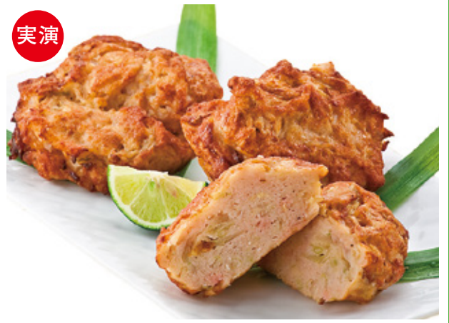
【小樽市・小樽飯櫃】 たこザンギ (4個入)……………本体価格 880 円(税込951円)