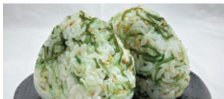
【小樽市・木の屋】日高昆布ちりめん (160g・1袋)……………本体価格 1,350 円(税込1,458円)