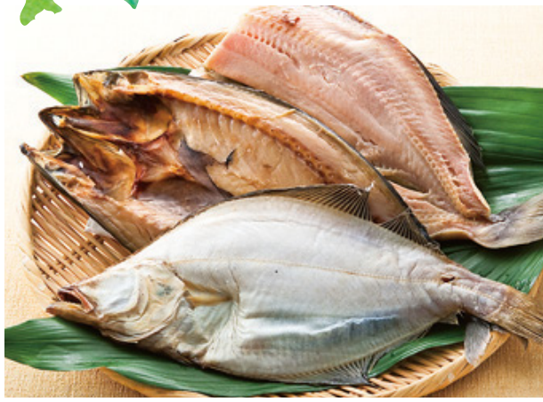
【函館市・カネニ】 真ホッケ・宗八カレイ・サバ (各1枚)……………本体価格 各 649 円(税込 各701円)

※ポイントサービスの対象外となります。※生鮮品・惣菜の写真はイメージの為、入数・容器が異なる場合がございます。※数に限りがございます。なくなり次第終了となります。※写真は盛り付けの一例です。 ※天候や交通事情により入荷が遅れる場合がございます。※都合により、店舗の出店が休止となる場合がございます。 ●後援：(一社)北海道貿易物産振興会、(公社)北海道観光振興機構、(一社)札幌物産協会、(一社)函館物産協会、(一社)小樽物産協会、(一社)旭川物産協会、(一社)帯広物産協会、(一社)千歳観光連盟、札幌市、函館市、小樽市、旭川市、釧路市、帯広市