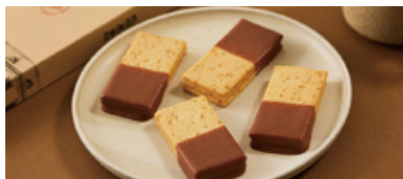
【札幌市・Kコンフェクト】開拓の詩(5個) [先着60点限り] 本体価格 1,000 円(税込1,080円)