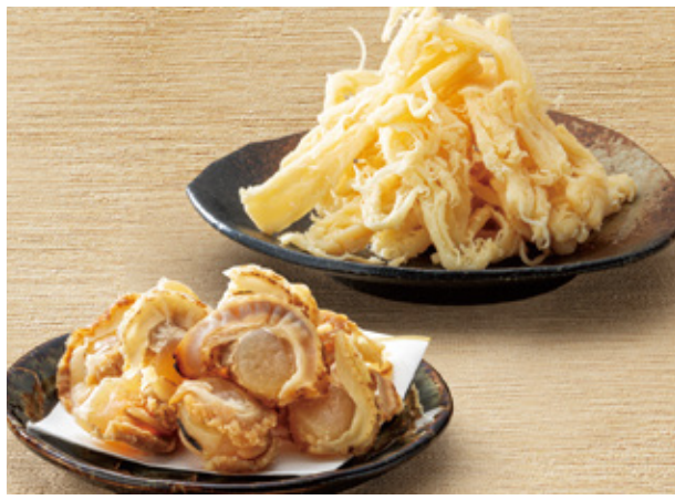
【旭川市・諸国名産珍味南部】 チーズさきいか(160g)・やわらか焼きほたて(100g) ……………本体価格 各 1,000 円(税込 各1,080円)