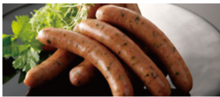
【札幌市・春雪さぶーる】 行者ニンニク入りソーセージ(205g・1パック) ……………本体価格 1,350 円(税込1,458円)