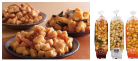
【砂川市・北菓楼】北海道開拓おかし (えりも昆布・函館いか・枝幸帆立/各1袋) ……………本体価格 454 円(税込491円)