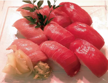
＜三重県産他＞ 本まぐろ握りづくし (大とろ、中とろ、赤身など) (養殖/9貫・1折) 2,580円 (税込2,787円) ※写真はイメージです。