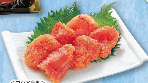
＜ロシア産他＞ 辛子明太子(切り) ※写真はイメージです。 (100g当り) 280円 (税込303円)