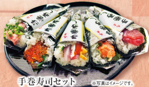
手巻寿司セット ※写真はイメージです。 (5本・1折) 980円 (税込1,059円)