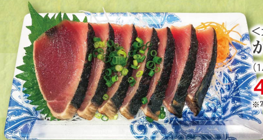
＜太平洋産他＞ かつおたたきお造り (1パック) 480円 (税込519円) ※写真はイメージです。