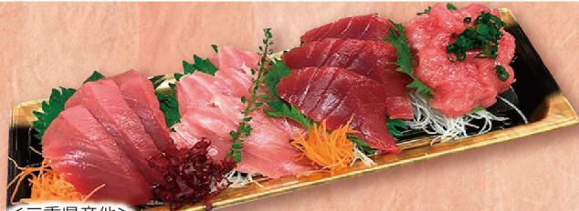
＜三重県産他＞ 本まぐろ刺身づくし(大とろ、中とろ、赤身、中落ちなど) (養殖/各3切・1パック) 2,580円 (税込2,787円) ※写真はイメージです。