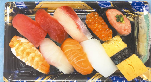
握り寿司セット ※写真はイメージです。 (10貫・1折) 980円 (税込1,059円)