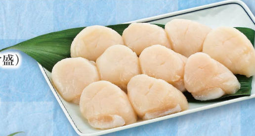
＜北海道産＞ ほたて貝柱 (解凍・生食用/100g当り) 550円 (税込594円) ※写真はイメージです。