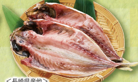
＜長崎県産他＞ 真あじ開き(2枚) 500円 (税込540円) ※写真はイメージです。