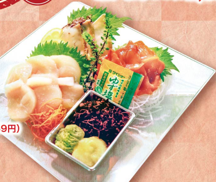
(各3切・1パック) 980円 (税込1,059円) ※写真はイメージです。