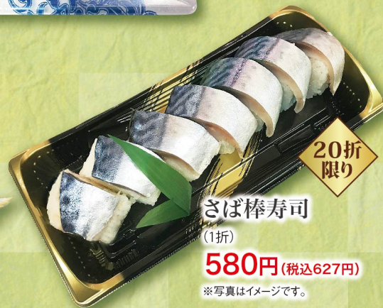
20折 限り さば棒寿司 (1折) 580円 (税込627円) ※写真はイメージです。