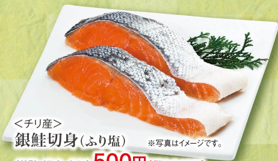
＜チリ産＞ 銀鮭切身(ふり塩) ※写真はイメージです。 (養殖・解凍/2切) 500円 (税込540円)