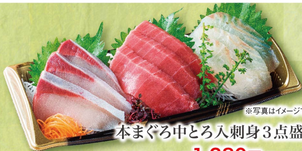
※写真はイメージです。 本まぐろ中とろ入刺身3点盛合せ (各3切・1パック) 1,280円 (税込1,383円)