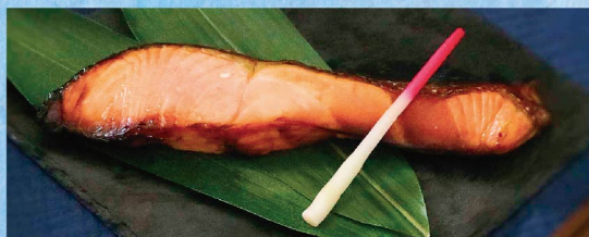
数量 限定 銀鮭西京焼 ※写真はイメージです。 (1切) 500円 (税込540円)