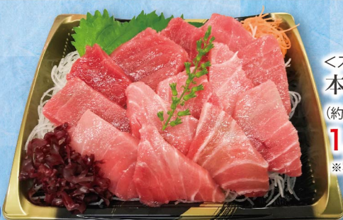
＜スペイン産他＞ 本まぐろお造り(のっけ盛) (約120g・1パック) 1,190円 (税込1,286円) ※写真はイメージです。