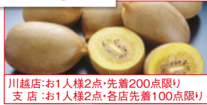
川越店:お1人様2点・先着200点限り 支店:お1人様2点・各店先着100点限り

〈ニュージーランド産〉 ゴールドキウイ(1パック) 本体価格 498円 (税込538円)