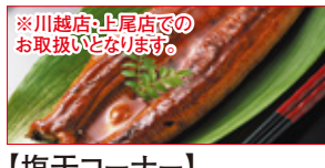
※川越店・上尾店での お取扱いとなります。

JA全農たまご 実りの赤たまご(10個入) 本体価格 238円 (税込258円)