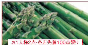
お1人様2点・各店先着100点限り

【デリカ味彩】ゴーゴー監修 ゴーゴーカレー(1個) 本体価格 500円 (税込540円)