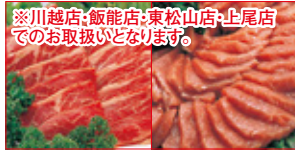
※川越店・飯能店・東松山店・上尾店 での取扱いとなります。

【東信水産】〈チリ産〉銀鮭 切身(ふり塩)(養殖・解凍/2切) 本体価格 500円 (税込540円)