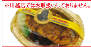
※川越店ではお取扱いしておりません。

ネスカフェ ゴールドブレンド・ こく深め・香り華やぐ (各80g)……本体価格 各 398円 (税込 各430円)