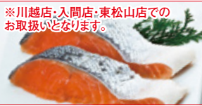
※川越店・入間店・東松山店での お取扱いとなります。

〈ニュージーランド産〉 ゴールドキウイ(1パック) 本体価格 498円 (税込538円)