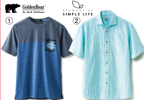
GoldenBear By Jack Nicklaus