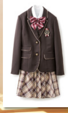
㊞子供フォーマル 3点セット (150~165cm)……19,224円 ・ジャケット(ポリエステル100%) ・ブラウス(ポリエステル100%) ・スカート (表地:ポリエステル75%・ レーヨン25%、 裏地:ポリエステル100%)

1月24日(火)までの期間中、 子供服フォーマルウェア対象 商品、レジにて20%OFF ※一部除外品がございます。