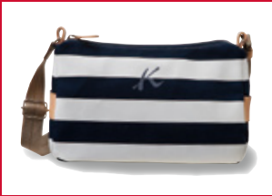
㊞ショルダー バッグ(綿・ 牛革/コン・ グレー・ベージュ) 15点限り 14,000円