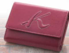
㊞三つ折り財布 (牛革/クロ・イエロー・ コン・ローズ) ……17,280円