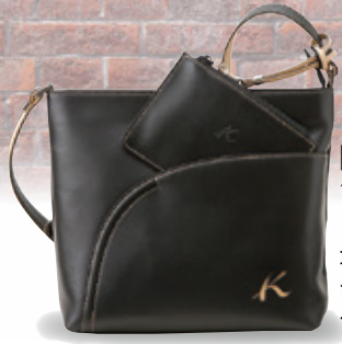
㊞牛革 ショルダーバッグ (牛革/コンシロ・ コンアカ・ クロベージュ) ……24,840円