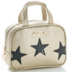
㊞ポーチ (牛革/クロ・ゴールド・ チョコ) ……10,260円