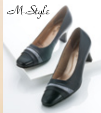
㊞〈M-Style〉 パンプス (22.0~24.5cm) ……9,612円 【1階=婦人靴】