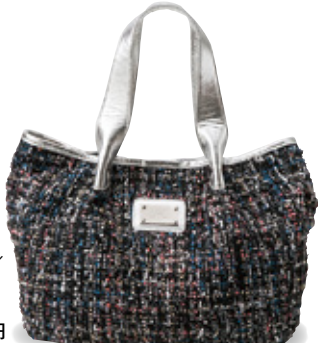
㊞ミックス ツイード ハンドバッグ (ツイード・ゴード/ ミックス・ピンク) ……24,840円

ヨコハマ元町で育んだ自由な発想やインターナショナルな感性をもとに 比類なきバッグ作りへのこだわりと、元町ストーリーが織りなす〈キタムラK2〉のバッグを 期間限定でご提供いたします。お買得の品々もご用意して 皆様のお越しをお待ちしております。