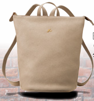
㊞リュックサック (牛革/コン・ グレイジュ・ポルドー) ……41,040円