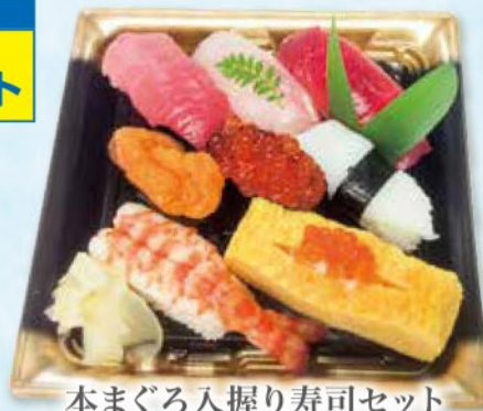
本まぐろ入握り寿司セット