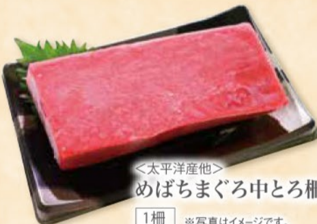
<太平洋産他> めばちまぐろ中とろ柵(刺身用)