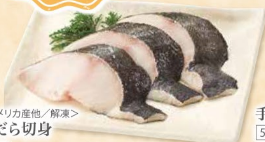
<アメリカ産他/解凍> 銀だら切身