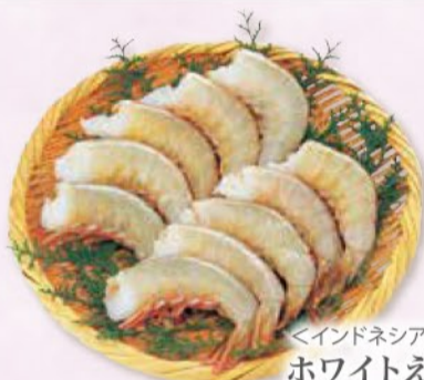
<インドネシア産/解凍> ホワイトえび