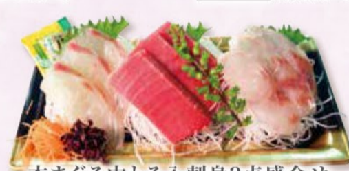
本まぐろ中とろ入刺身3点盛合せ