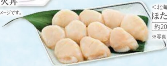
<北海道産/解凍> ほたて貝柱