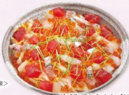
海鮮ばらちらし寿司