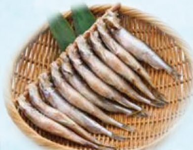
<北海道産/解凍> 本ししゃも