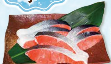
鮭食べ比べセット(秋鮭・紅鮭・銀鮭)