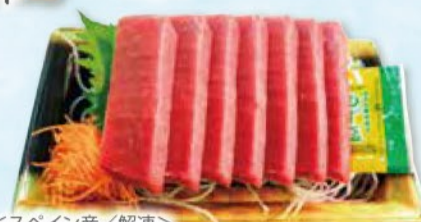
<スペイン産/解凍> 本まぐろ中とろ刺身