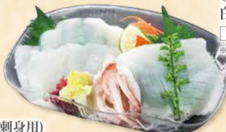
<長崎産他> 白いか刺身