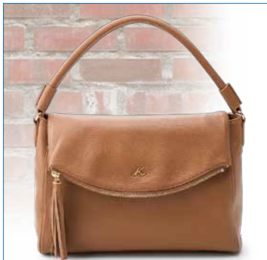
■セミショルダーバッグ (牛革/ クロ・コン・キャメル) ……………27,000円