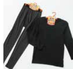
●紳士裏起毛肌着 各種 ……………756円