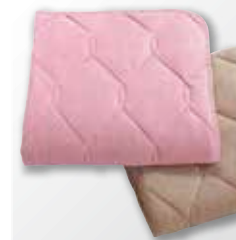
●〈昭和西川〉 調湿あたたかパッドシート (綿50%・アクリル30%・キュプラ20%/ Sサイズ)……………4,536円