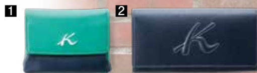
1 財布(牛革/コンシロ・エンリコ・グレージュ・ チョコベージュ・グリーンコン)……………8,316円