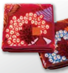
●〈昭和西川〉 クォーターケット (100×70cm)……………2,646円

素材はアクリル100%であたたか。お家の中ではもちろん、 オフィスなどでの寒さ対策にもおすすめ。