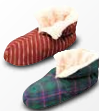
●ルームシューズ 各種 ……………972円

羽毛のような弾力性のある ボア生地で、発熱保温。 家の中でも快適に過ごせ ます。