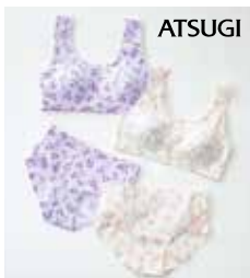
●シームレス ブラトップ……………1,296円 ショーツ……………583円