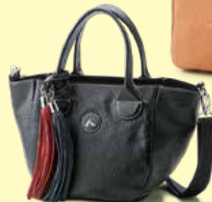
■ハンドバッグ (牛革/クロ)