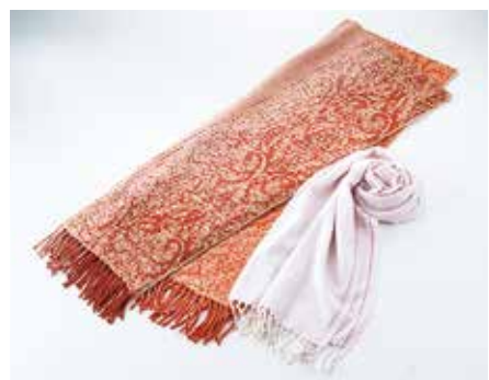
婦人マフラー各種 .....3,000円+税 【1階=婦人雑貨】