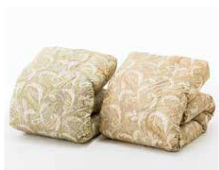
羽毛ふとん(ウクライナ産ホワイトダック85%・ 1.2kg、ふとん側:綿70%・ポリエステル30%) .....20,000円+税