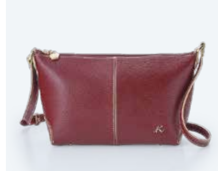
セミショルダーバッグ (牛革).....21,000円+税