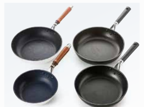
一例として) ガス火専用フライパン (26cm).....3,000円+税 【4階=家庭用品】