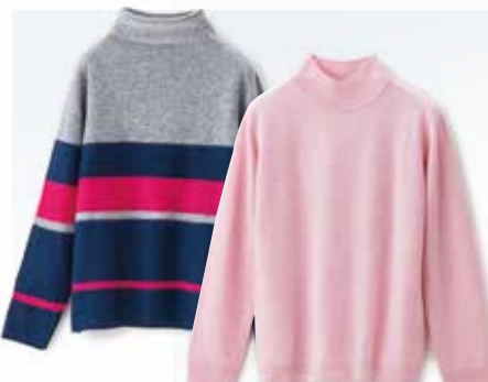
婦人カシミアニット各種 .....5,000円+税 【2階=婦人服】