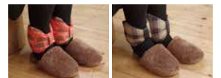
リボンウォーマー(詰物:Jumouエシカルダウン 80%相当・26g/フリーサイズ/長さ約36×高さ (最大)約14cm).....3,300円+税から