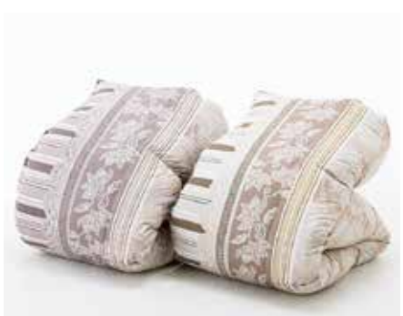
羽毛ふとん(ウクライナ産シルバークース93%・ 1.2kg、ふとん側:綿65%・ポリエステル35%) .....50,000円+税