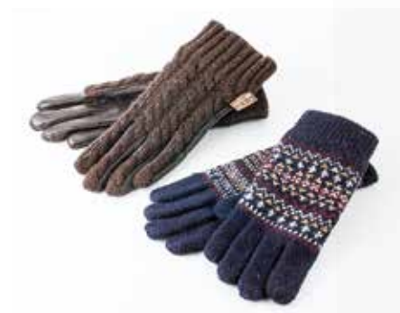
紳士手袋各種 .....2,000円+税 【3階=紳士雑貨】