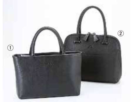
①ハンドバッグ(牛革/クロ) 25,000円+税 ②ハンドバッグ(牛革/クロ) 31,000円+税

◆1月13日(水)~19日(火) 〈最終日は午後5時終了〉 ◆1階=エンジョイスペース