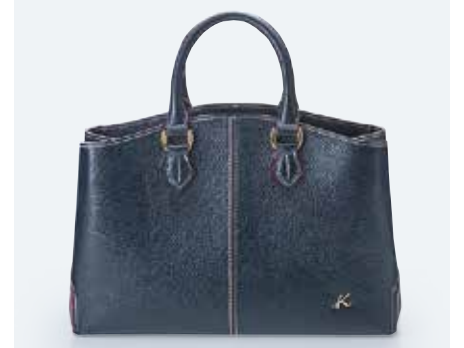
ハンドバッグ (牛革).....30,000円+税