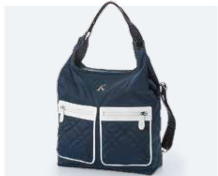
2WAYセミショルダーバッグ (ナイロン).....22,000円+税