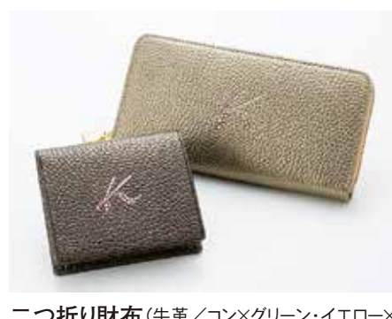
二つ折り財布(牛革/コン×グリーン・イエロー× チャ・クロ×ピンク・ゴールド).....15,000円+税 長財布(牛革/コン×グリーン・イエロー×チャ・ クロ×ピンク・ゴールド).....18,000円+税