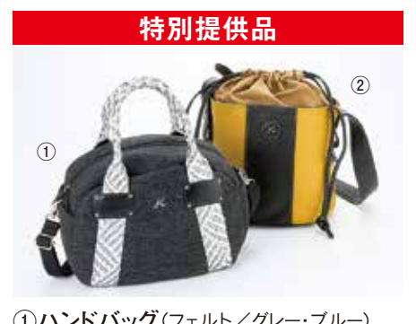
特別提供品 ①ハンドバッグ(フェルト/グレー・ブルー).....11,500円+税 ②セミショルダーバッグ(牛革/クロ×クロ・ ピンク×ベージュ・マスタード×クロ).....17,500円+税