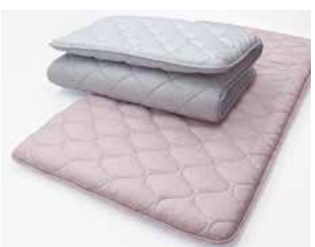
軽量敷きふとん(詰物:毛50%・ポリエステル50%・ 0.7kg、ポリエステル100%(ウレタンプロファイル)、 ふとん側:綿100%).....12,000円+税