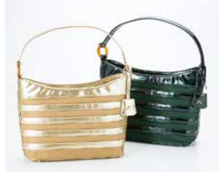
セミショルダーバッグ (合皮エナメル・ナイロン/コン・ダークグリーン・ ゴールド).....15,000円+税