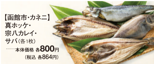
【函館市・カネニ】真ホッペ・宗八カレイ・サバ(各1枚) 本体価格 各 800円 (税込 各864円)