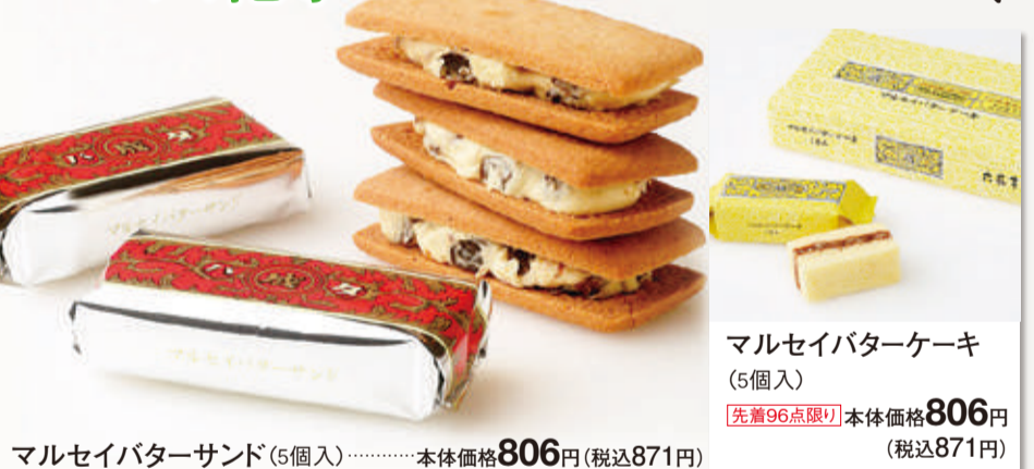
マルセイバターサンド(5個入) 本体価格 806円 (税込871円) マルセイバターケーキ(5個入) 先着96点限り 本体価格 806円 (税込871円)