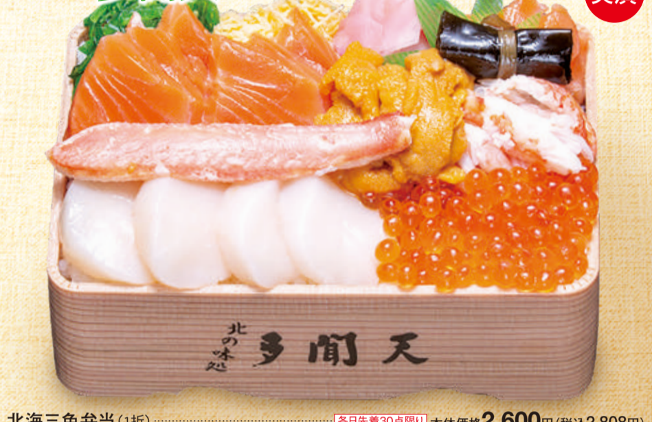
北海三色弁当 (1折) 各日先着30点限り 本体価格 2,600円 (税込2,808円)