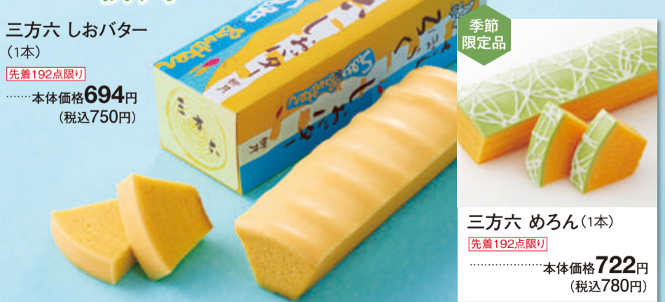
三方六 しおバター(1本) 先着192点限り 本体価格 694円 (税込750円) 三方六 めろん(1本) 先着192点限り 本体価格 722円 (税込780円)