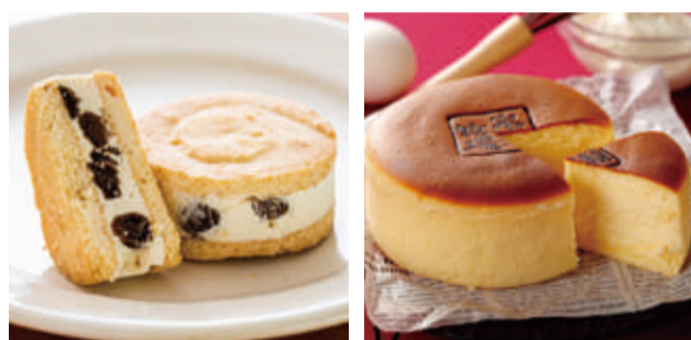
【札幌市・ノースカカオ】レーズンサンドグラン(3個入) 先着50点限り 本体価格 926円 (税込1,001円) 【砂川市・岩瀬牧場】窯出しチーズケーキ(4号) 先着24点限り 本体価格 1,528円 (税込1,651円)