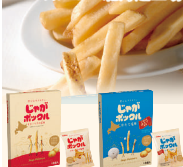
じゃがポックル ①オホーツクの塩味(18g×10袋)・②ほたて塩味(17g×10袋) 本体価格 各 1,122円 (税込 各1,212円)