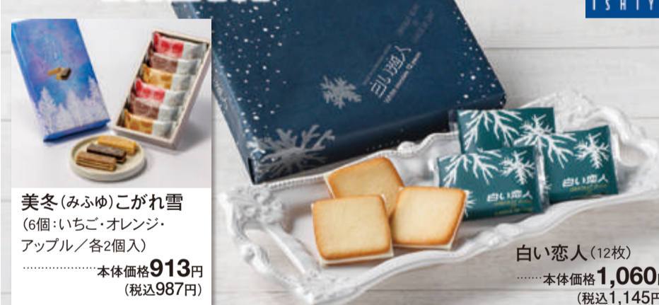
美冬(みふゆ)こがれ雪 (6個:いちご・オレンジ・アップル/各2個入) 本体価格 913円 (税込987円) 白い恋人(12枚) 本体価格 1,060円 (税込1,145円)