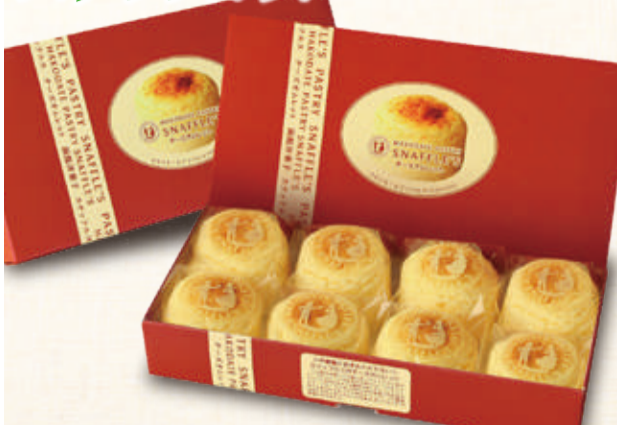
①チーズオムレット(8個入) 各日先着15点限り 本体価格 1,800円 (税込1,944円) ②抹茶シヨコラ(4個入) 先着60点限り 本体価格 900円 (税込972円)