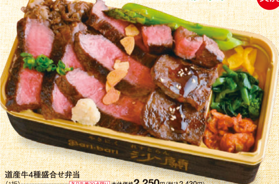
道産牛4種盛合せ弁当 (1折) 各日先着30点限り 本体価格 2,250円 (税込2,430円)