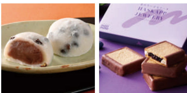
【帯広市・柳月】豆大福(冷凍/4個入) 先着132点限り 本体価格 500円 (税込540円) 【千歳市・morimoto】ハスカップジュエリー(4個入) 先着40点限り 本体価格 1,186円 (税込1,281円)