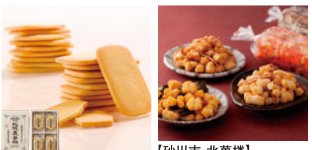
【札幌市・札幌農学校】北海道ミルククッキー(12枚入) 先着80点限り 本体価格 675円 (税込729円) 【砂川市・北菓楼】北海道開拓おかし(えりも昆布・函館いか・枝幸帆立/各1袋) 先着200点限り 本体価格 454円 (税込491円)