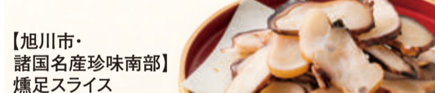
【旭川市・諸国産産味南部】燻足スライス(100g) 本体価格 1,000円 (税込1,080円)