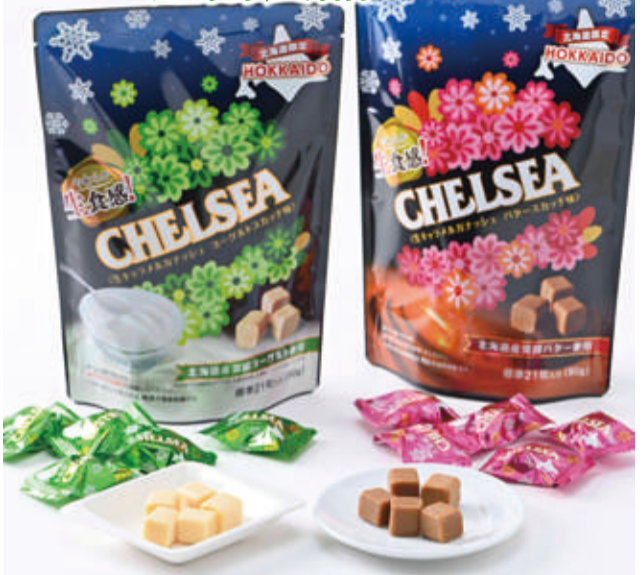
初出品 北海道限定 生食感チェルシー(ヨーグルトスカッチ・バタースカッチ)(各1袋) 各日1人様各2点・先着各150点限り 本体価格 各 900円 (税込 各972円)