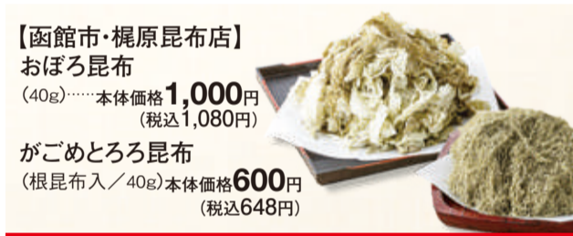
【函館市・梶原昆布店】おぼろ昆布(40g) 本体価格 1,000円 (税込1,080円) 【小樽市・小樽飯櫃】たごザンギ(4個入) 本体価格 880円 (税込951円)