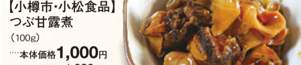
【小樽市・小松食品】つぶ甘露煮(100g) 本体価格 1,000円 (税込1,080円)