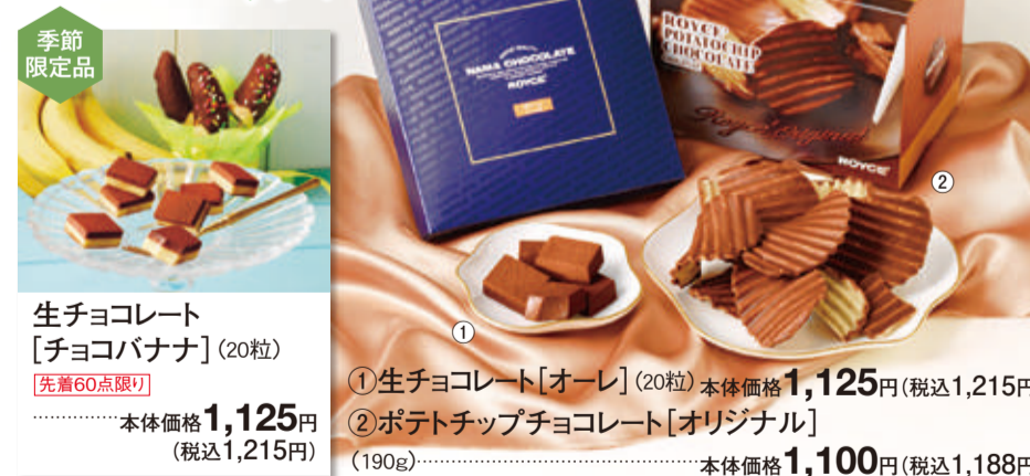
生チョコレート【チョコバナナ】(20粒) 先着60点限り 本体価格 1,125円 (税込1,215円) ①生チョコレート【オーレ】(20粒) 本体価格 1,125円 (税込1,215円) ②ポテトチップチョコレート【オリジナル】(190g) 本体価格 1,100円 (税込1,188円)