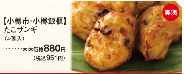
【旭川市・イワシタ】海藻サラダ(250g) 本体価格 1,200円 (税込1,296円)