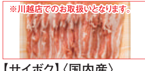
※川越店でのお取扱いと異なります。

【サイボク】〈国内産〉 ゴールデンポークバラ スライス(100g当り) ……本体価格 488円 (税込528円)