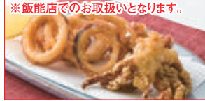
※飯能店でのお取扱いと異なります。

【デリカ味彩】 真いかリング唐揚げ(100g当り) ……本体価格 198円 (税込214円)