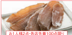
お1人様2点・各店先着100点限り

【デリカ味彩】 真いかリング唐揚げ(100g当り) ……本体価格 198円 (税込214円)