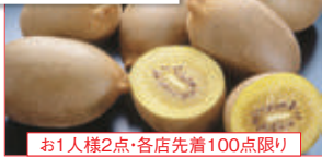
お1人様2点・各店先着100点限り

【東信水産】 鮭食べ比べセット (ニュージランド産)ゼスプリ サンゴールドキウイ(1パック) ……本体価格 498円 (税込538円)