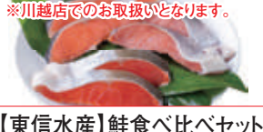
※川越店でのお取扱いと異なります。

【東信水産】 鮭食べ比べセット (ニュージランド産)ゼスプリ サンゴールドキウイ(1パック) ……本体価格 498円 (税込538円)