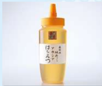
アカシアはちみつ (500g) .....本体価格 2,100 円(税込2,268円)