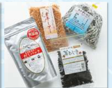
おかずいりこ (200g) .....本体価格 1,200 円(税込1,296円)