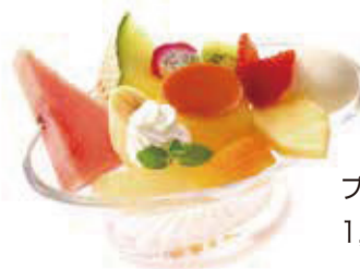
プリン・ア・ラ・モード 1,100円+税

新宿高野の飲食業態として、1926年から90年以上の歴史とともに歩んできたタカノフルーツパーラー。季節のフルーツを美味しく味わえるように仕立て、パフェやデザートなどを中心に展開しています。