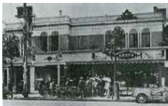
大正15年(1926年) 開業当時のフルーツパーラー

新宿高野の飲食業態として、1926年から90年以上の歴史とともに歩んできたタカノフルーツパーラー。季節のフルーツを美味しく味わえるように仕立て、パフェやデザートなどを中心に展開しています。