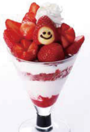
栃木県産とちおとめ苺のスマイルパフェ 1,600円+税

「タカノフルーツパーラー オープニングメニュー」 ご提供期間: 11/13(水)~12/8(日)