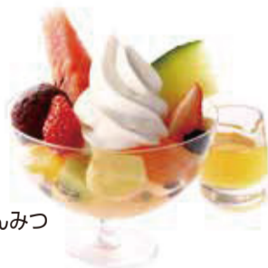
クリームあんみつ 1,100円+税

たくいまれな芳香と、とろけるような芳醇な味わいが特長のマスクメロン。オリジナルブレンドのソフトクリームに、香り高いマスクメロンのシャーベット、グラニテ、果汁を合わせ仕立てました。グラスの底までマスクメロンをお楽しみいただける一品です。