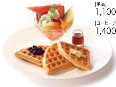
フルーツワッフル [単品] 1,100円+税 [コーヒーまたは紅茶付] 1,400円+税