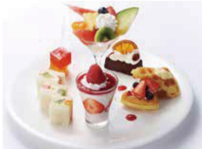
タカノアラカルトプレート コーヒーまたは紅茶付 1,700円+税

にっこり笑顔のいちごちゃんがお出迎えする、オープニング限定パフェ。ソフトクリームとさっぱりとした苺リンググラニテを重ね、甘酸っぱい苺をシンプルにお召し上がりいただけます。