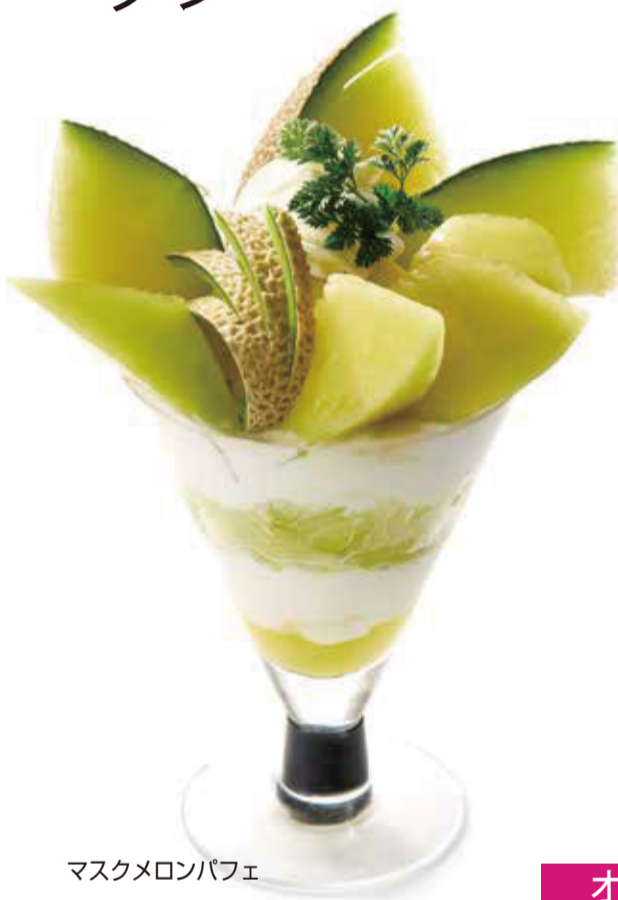
マスクメロンパフェ 2,000円+税

クラシックメニューのフルーツサンドウィッチやワッフル、ミニパフェ、グラスケーキなどを一皿で味わえます。タカノフルーツパーラーの様々なデザートをお楽しみください。