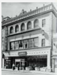
昭和11年(1936年)の新宿本店ビル

新宿高野は1885年(明治18年)、東京・新宿に『フルーツ専門店』として産声を上げて以来、新宿の街と共に発展し、来年は創業135周年を迎えます。これまで、産地や生産者に注目し、自社工場を設立、フルーツの魅力を生かしたオリジナル商品の開発、さらにはフルーツパーラーを展開するなど、常にフルーツの美味しさとお可能性を追求してきました。